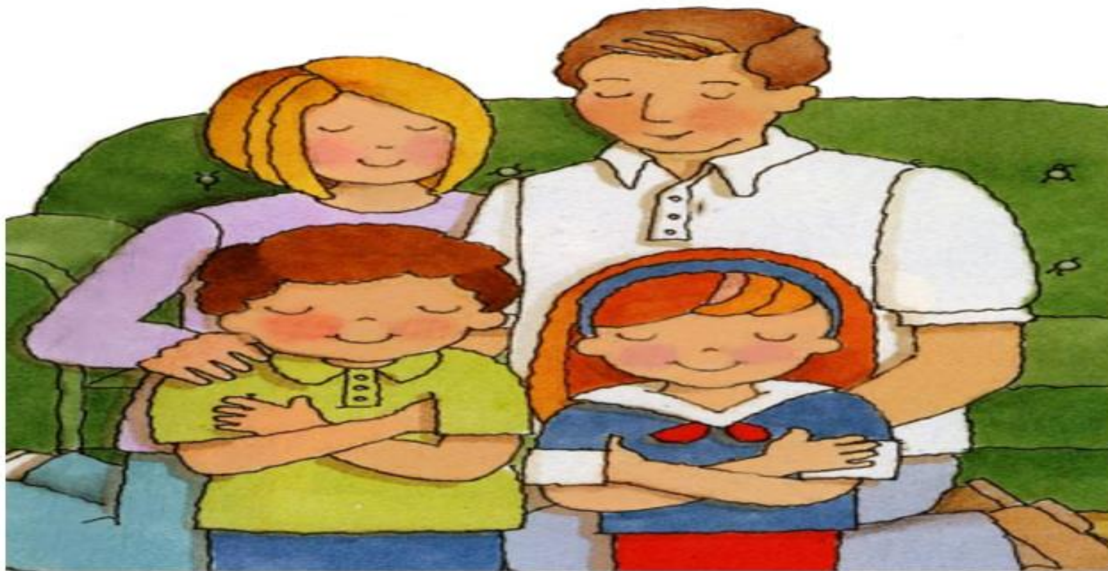
LA FAMILIA ORA A DIOS PREPARANDOSE PARA EL SABADO