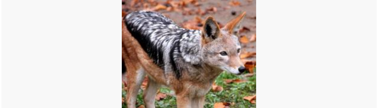
Chacal de lomo negro

metro de longitud, sin contar la cola, la cual le mide 30 centímetros, y a pesar 15 kg. Vive en zonas áridas, sabanas y desiertos en el sur de Europa, sur de Asia y norte de África.